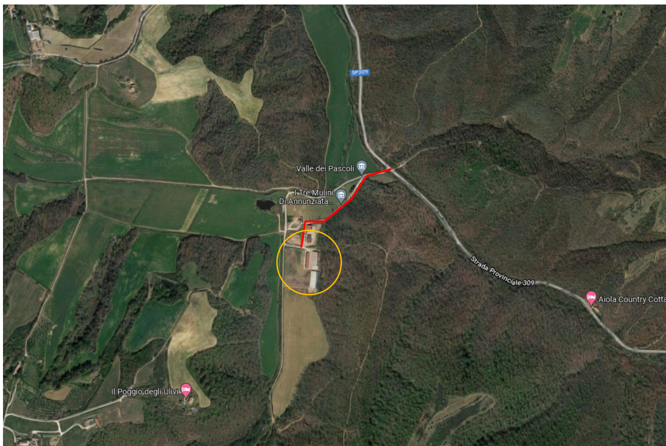
Indicazione di viabilità da strada principale ad area di cantiere

ORDINE DEGLI ARCHITETTI OOTT. ARCH. DAVIDE FARALLI 1266 DELLA PROVINCIA DI PERUGIA