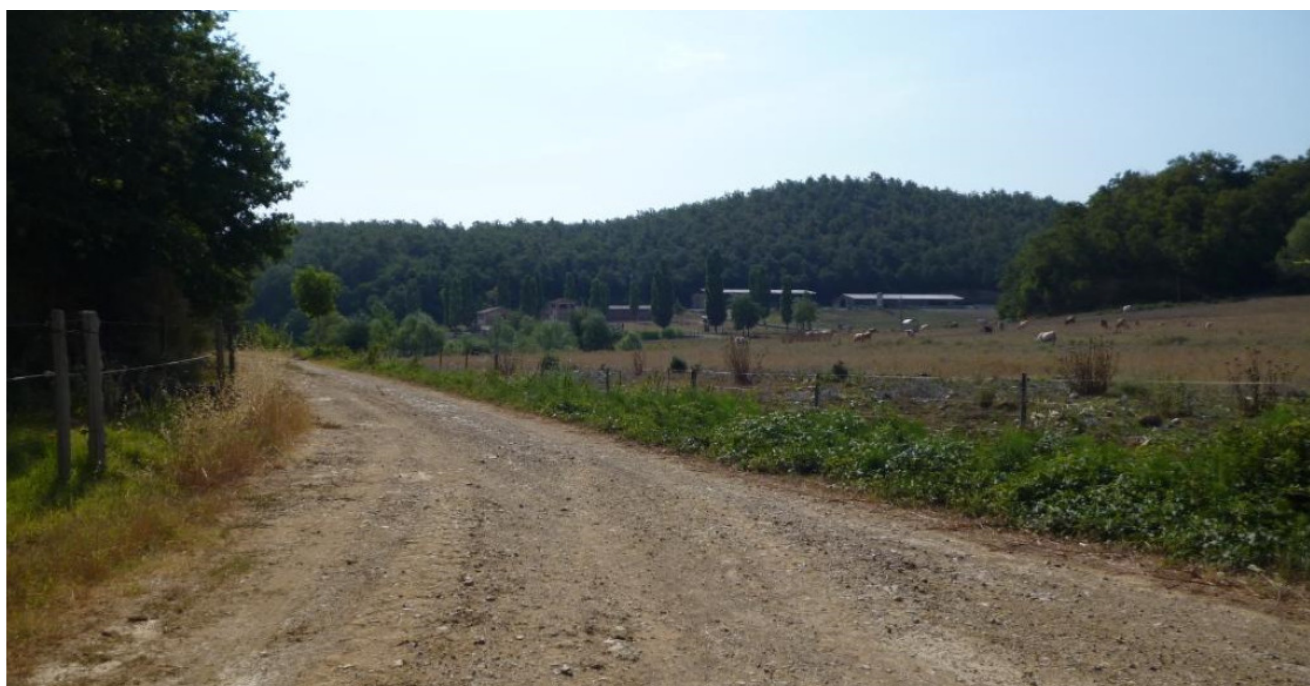
Area intervento da ovest