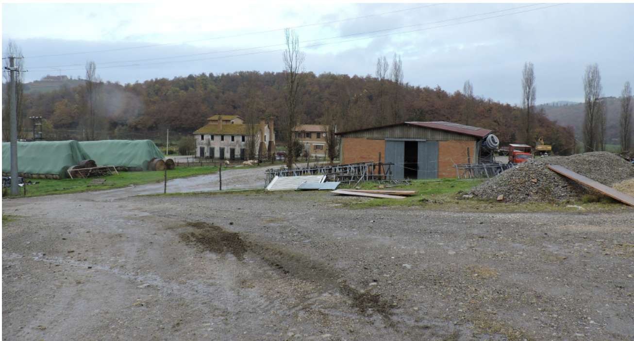
Area intervento fienile